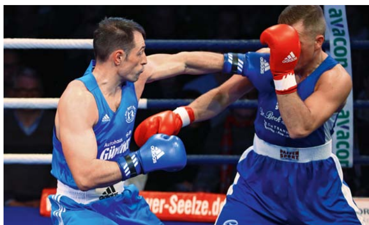
Auftakt für die neue Saison: Am 10. Dezember stiegen die Boxer vom BSK Hannover-Seelze gegen den BC Chemnitz 94 in den Ring.

| www.avacon.de/bsk-hannover-seelze.de | | www.bsk-hannover-seelze.de |