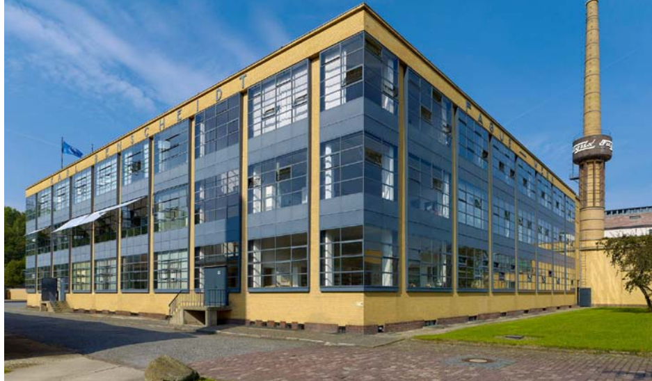
Das Fagus-Werk – ein tolles Ausflugsziel für alle, die sich für Architektur und Industriekultur interessieren.