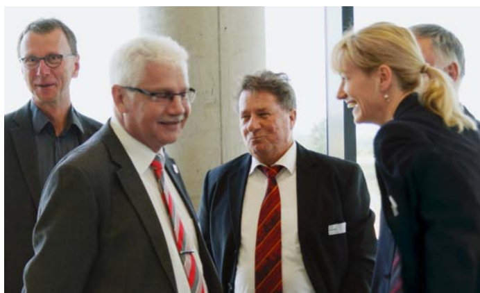
Der „Kommunale Dialog“ bietet Raum zum Austausch sowie interessante Impulse.